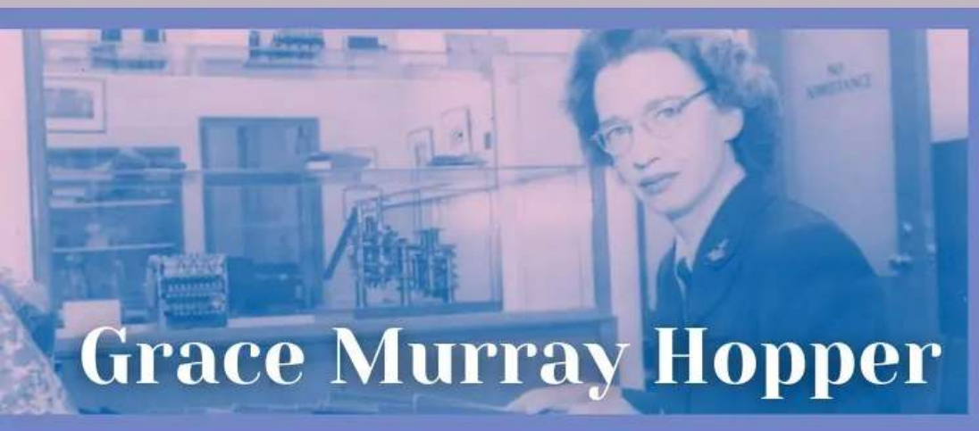
Grace Murray Hopper

Pionera en el campo de diseño de chips microelectrónicos. Sus innovaciones durante los años 70, han causado un enorme impacto en el diseño de chips a nivel mundial y gran cantidad de compañías especialistas en alta tecnología, así como numerosos métodos informáticos se basan en su trabajo.